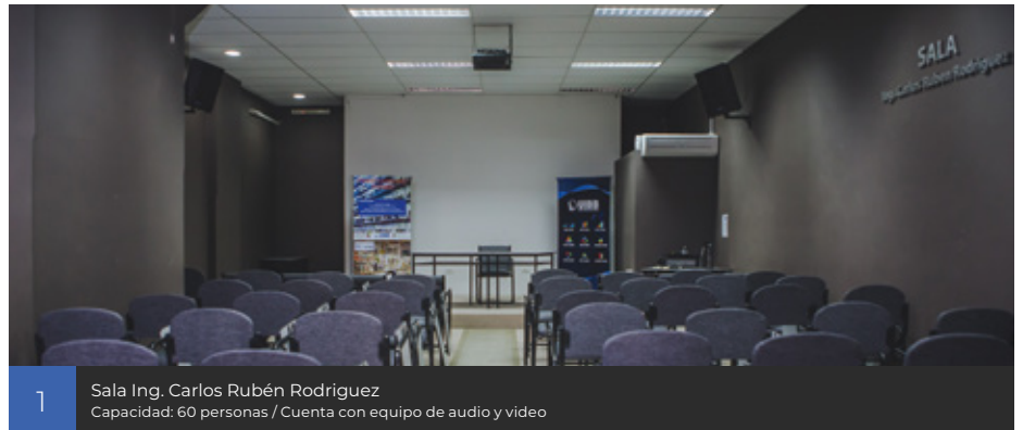
1 Sala Ing. Carlos Rubén Rodríguez Capacidad: 60 personas / Cuenta con equipo de audio y video

Le responderemos a la brevedad para informarle sobre disponibilidad y detalles acerca de su uso.