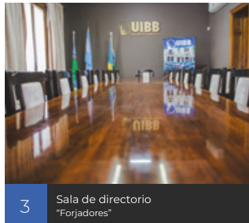
3 Sala de directorio "Forjadores"