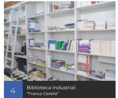
4 Biblioteca Industrial "Franco Cerella"