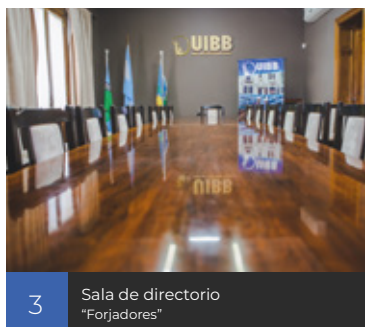
3 Sala de directorio "Forjadores"