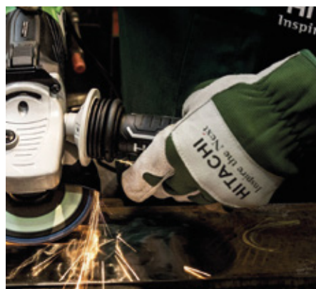
Evolución de la Actividad Metalúrgica