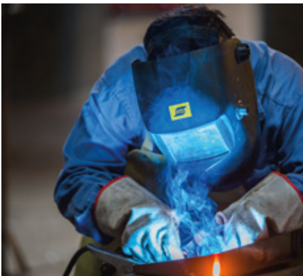
Índice de Demanda Laboral Industrial