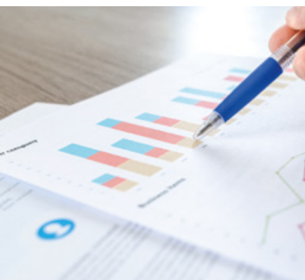
Índice de Costos Industriales