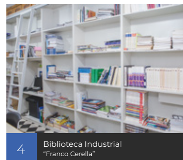
4 Biblioteca Industrial "Franco Cerella"