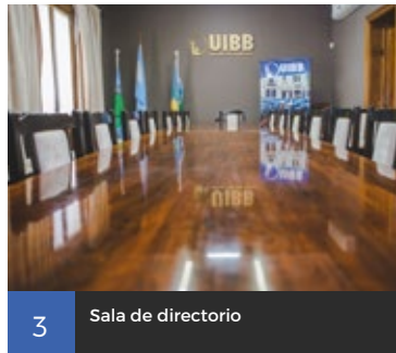
3 Sala de directorio