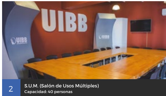
2 S.U.M. (Salón de Usos Múltiples) Capacidad: 40 personas