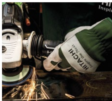
Evolución de la Actividad Metalúrgica