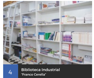
4 Biblioteca Industrial "Franco Cerella"